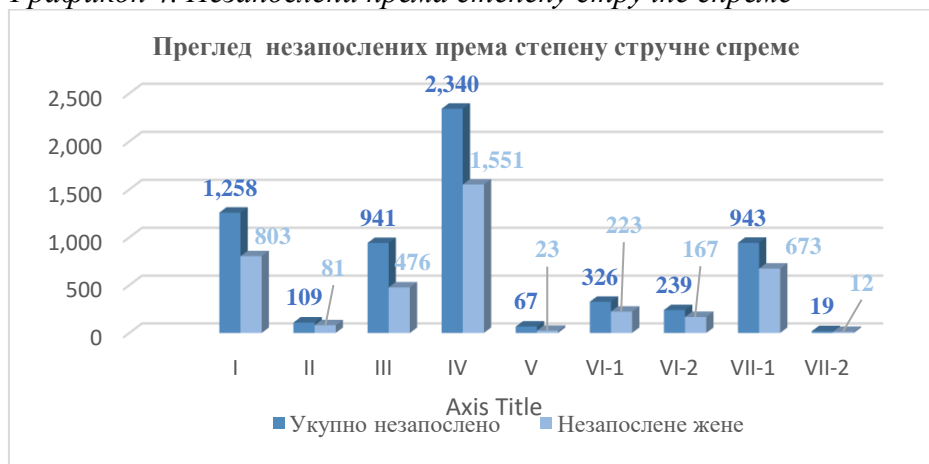
Графикон 4. Незапослени према степену стручне спреме

Највећи број незапослених лица, закључно са 31. јануаром 2022. године, је са средњом и високом стручном спремом. Евидентан је и број незапослених лица без квалификације и у трећем степену образовања.