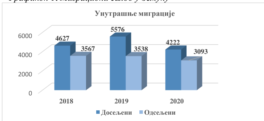
Графикон 1. Миграциони салдо у Земуну