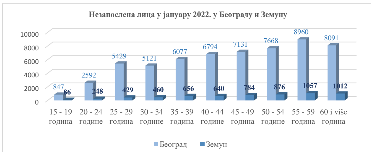
Графикон 3.Преглед незапослених лица у Београду и Земуну према годинама старости

У погледу старосне структуре, из табеларног приказа и Графикана бр.3 евидентно је да је највеће учешће незапослених лица у старосној доби од 55-59 године живота и 60 и више година.