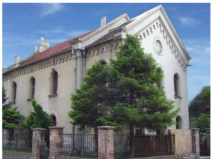
Синагога у Улици Рабина Алкалаја 5

Пројекат је намењен свим грађанима Србије без обзира на веру, пол, старост и степен образовања. У рад конференције укључиће се и Земунска гимназија, као и Основна школа „Светозар Милетић“.