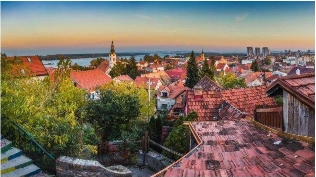
НАЈЛЕПШИХ 20 ФОТОГРАФИЈА ЗЕМУНА 2019.